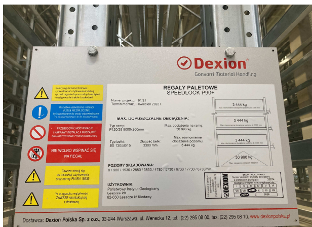
Obecna tabliczka regałowa