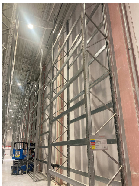
Widok regałów wysokiego składowania – regał pojedynczy przy ścianie